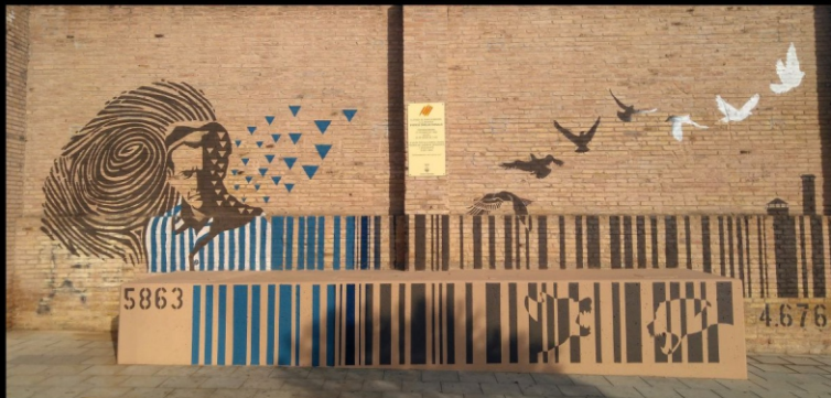
Memorial Esteve Cañellas Margalló

Amb la participació dels alumnes de l'Escola Municipal de Música de Torredembarra.